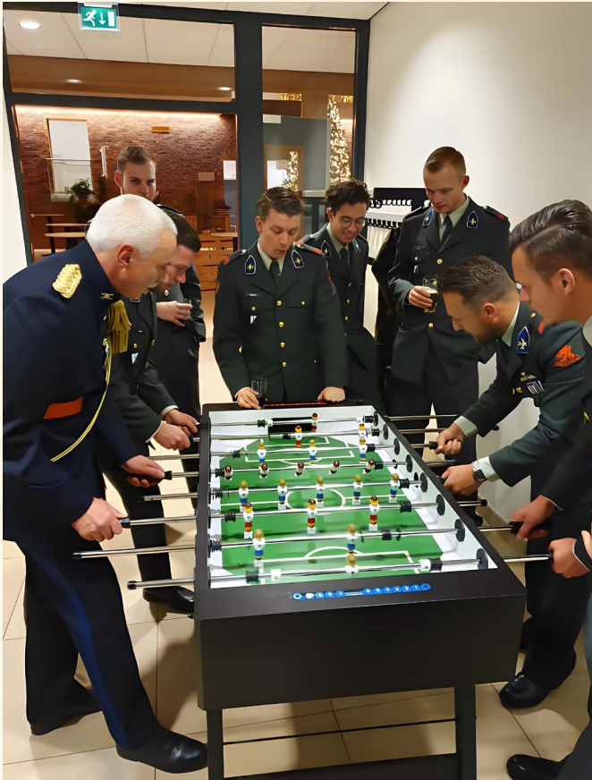
Tafelvoetbal tijdens Soldaat Clasener Diner

te geven aan onze visie. Met een grote groep regimentsleden hebben we veel ideeën opgehaald en uitgewerkt. Onder meer met de introductie van de onderofficier specialist. Vaak leidde dit tot emotionele discussies en dat toont ook de betrokkenheid aan. Andere ideeën hebben geleid tot een reservistencapaciteit en samenwerking met het bedrijfsleven.