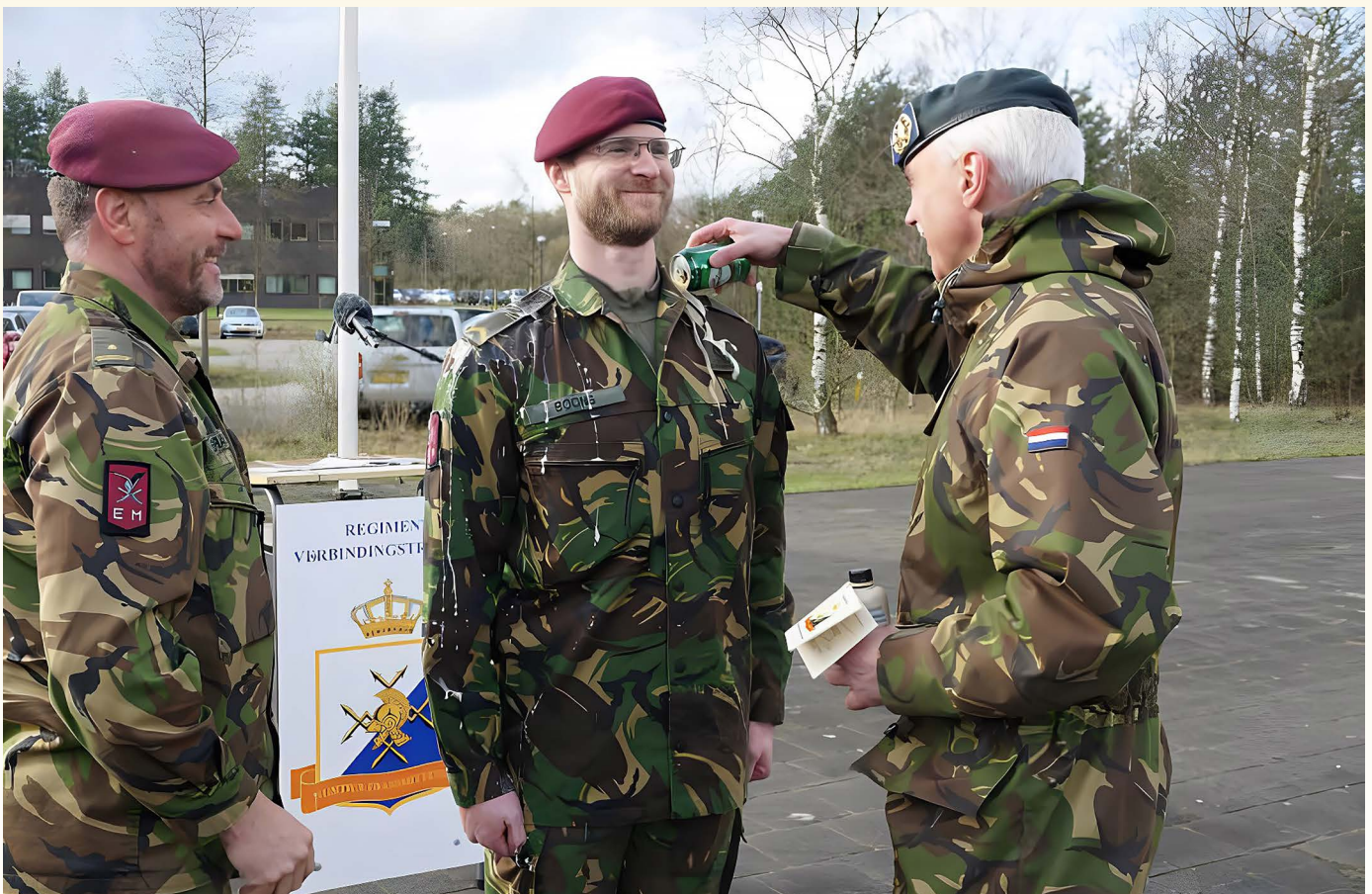
Bevordering tot Sergeant Specialist

Ons vakgebied vraagt om snelle veranderingen, maar met name vraagt het om veranderen. Dat is namelijk een werkwoord. Dat is nodig om relevant te zijn en te blijven. Iets dat we de afgelopen 150 jaar hebben laten zien en ik heb er vertrouwen in dat we dat blijven laten zien. Dat kan alleen samen, dus ook nu geldt nog steeds: waarom moeilijk doen als het samen kan.